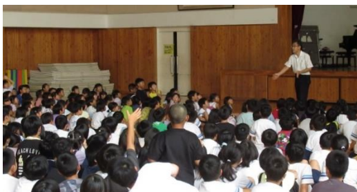
勢いよく飛びあがった竹とんぼ

勢いよく飛びあがった竹とんぼをした時、その音が聞こえるか、挑戦しました。全校で静かに集中したときの体育館の雰囲気。期待感と聞き漏らすまいとする子どもたちの姿がありました。普段の学校生活でもこの雰囲気や感覚を活かしてほしいと思います。さて、針を落とした音ですが、後方にいる5年生も「聞こえた！」と伝えてくれました。