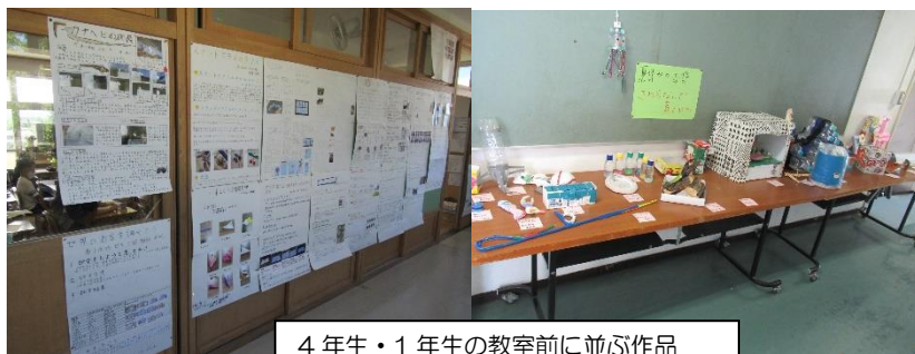
4年生・1年生の教室前に並ぶ作品

暦の上では秋を迎えておりますが、まだまだ暑い日々が続いております。お見舞い申し上げます。さて、寿小学校では、8月18日、2学期がスタートし、教室前の廊下には、夏休み中に子どもたちがご家庭で取り組んだ研究や作品の力作が展示されています。ご協力に感謝いたします。