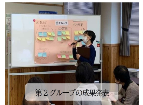
第2グループの成果発表

各グループで共通する課題としては、昔のような「向こう3軒両隣」のつながりがだんだん薄れてきていること、「日頃のコミュニケーション不足」などで、解決策としての意見は「隣組が基本として大事なので、隣組単位で災害時の助け合い等について話し合いの機会を増やす」「コロナ禍で中止していた新年会などの町会行事を積極的に開催する」「隣組単位で年に1~2回昼食会を開催してお互いの状況を知り合う」などでした。向こう3軒両隣のような小さな単位で、日ごろからお互い顔の見える関係を築くことが、要支援者の安否確認を含め災害時の自助・共助の推進につながる重要な要素といえます。