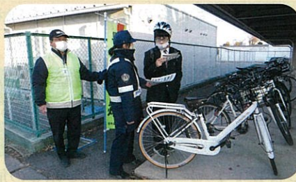
「年末の交通安全運動」の活動で、管内の高校において自転車ヘルメットの着用啓発を実施した。(須高)