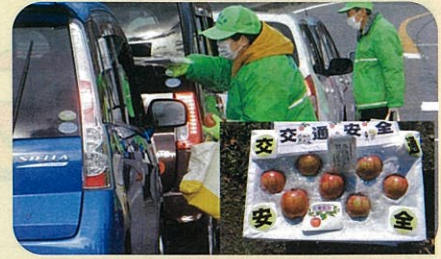
「年末の交通安全運動」で、ドライバーに「交通安全文字入りりんご」を手渡して交通事故防止を指導した。(川西)