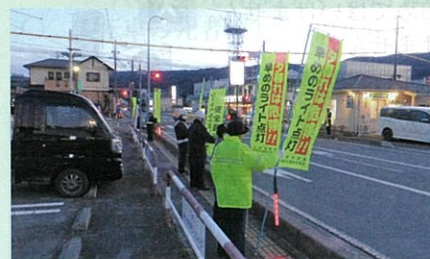
「年末の交通安全運動」で、市役所西県道交差点において街頭啓発活動を実施した。(茅野)