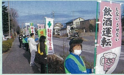
「年末の交通安全運動」で、御代田町内の県道において飲酒運転防止などを呼び掛けた。(佐久)