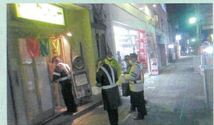
「年末の交通安全運動」で、飲食店を対象とした「飲酒運転防止パトロール」を実施した。(飯伊)