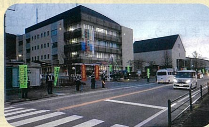
「年末の交通安全運動」で、諏訪警察署前において街頭啓発活動を実施した。(諏訪)