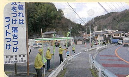
「年末の交通安全運動」で、管内の国道において街頭啓発活動を実施した。(阿南)