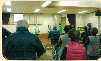
管内の公民館において高齢者に対する交通安全教室を開催した。(小諸)