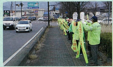
「年末の交通安全運動」の活動で、松代大橋前県道において街頭啓発活動を実施した。(長野南・松代)