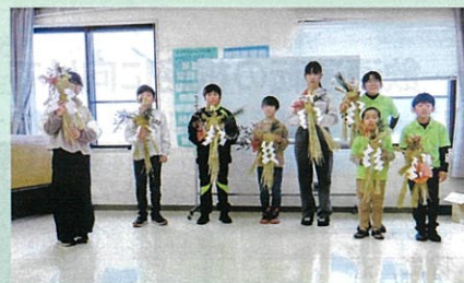
「年末の交通安全運動」で、少年部による交通安全を祈願した「正月飾り作成研修会」を開催した。(安曇野)