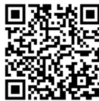
▲生活ガイドブック・防災ハンドブック (松本市HP)

人権共生課では「生活ガイドブック」、「防災ハンドブック」をそれぞれ9言語で作成しています。いずれも、市ホームページでご覧いただけますのでご利用ください。また、「外国人住民の生活オリエンテーション」などをテーマに出前講座を行えますので、お気軽にお問い合わせください。