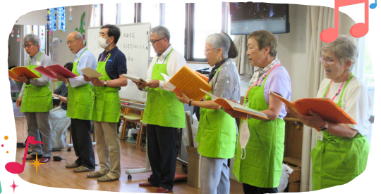
プラチナコーラス