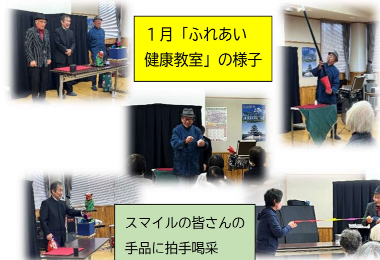
1月「ふれあい健康教室」の様子

※各町会の公民館からひろばまで無料送迎タクシー運行中。送迎希望の方は3月7日(木)までにお申し込みください。