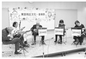
東部クラシコマンドリーノ