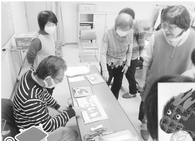
▲千支押絵雛講座(11月20日)