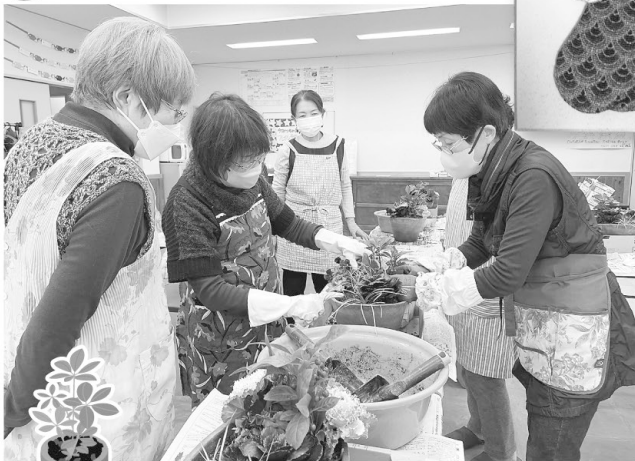
▲寄せ植え講座(12月14日・福祉ひろば)