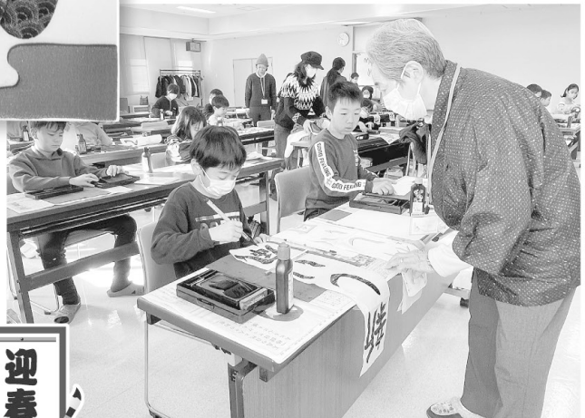
▲新春 書初め大会(1月4日)