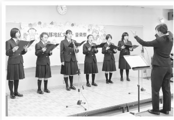
清水中学校合唱部

音楽祭の部では、2日間通じて公民館所属サークルや地元で活躍する音楽家等、総勢7組の演奏が披露され、それぞれ大きな拍手に包まれました。文化祭の部では、書道や俳句、手芸等の多くの力作が展示され、来場者の目を楽しませていました。