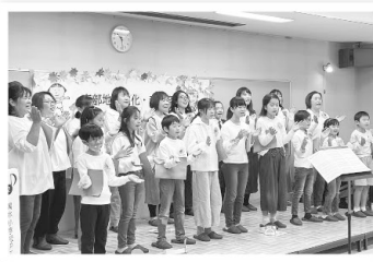
清水小PTA親子コーラス