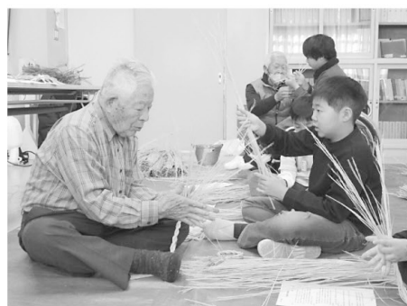
▲清水小学校 しめ縄作り体験(12月19日)

12月18日から22日には、東部書道サークル「楽しい書道教室」の皆さんのご協力により、清水中学校国語科授業で書写指導補助を行いました。 12月19日には東部地区の方々にご協力いただき、清水小学校5年2組の皆さんに「しめ縄作り体験」の指導を実施しました。