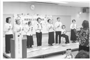
東部コーラス オーロラ