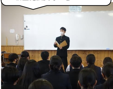
全体会 新生徒会長あいさつ

生徒総会の翌日には、生徒会役員引き継ぎ会が行われました。始めに全体会を行った後、各会場では、委員会ごとの引き継ぎが行われました。来年度からは、委員会の数が12となります。（福祉交流委員会と環境委員会、購買委員会と情報編集委員会が統合）3年生の役員の方々は、委員会の活動内容や当番活動など、具体的な仕事内容を2年生に伝えることはもちろんですが、今年1年間を振り返って、自分たちがやってきたことの成果と課題も2年生に伝えていました。2年生は、真剣な表情でメモをとりながら3年生の話を聞いていました。3年生が引き継いできてくれた伝統を更に受け継ぎ、新たな生徒会を2年生が創りあげていってくれることと思います。