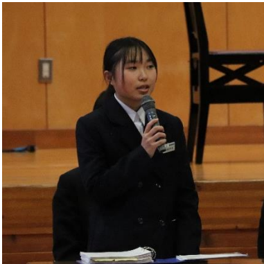
令和5年度生徒会長あいさつ

また、最後には来年度の生徒会役員も紹介され、来年度の生徒会活動への期待も高まりました。2年生が主役となって活動する来年度の生徒会活動も楽しみです。