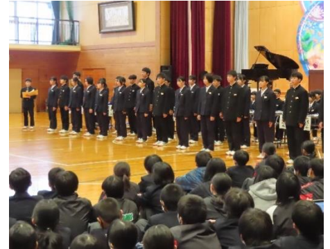
次年度の役員を紹介