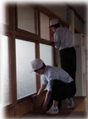
窓のさんも拭いてきれいに