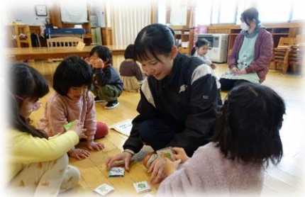
おもちゃを使ってみんなで遊びます

家庭科の授業の一環として、3年生の各クラスが朝日保育園にて、保育園実習を行いました。家庭科の授業中に作ったおもちゃを持参して、園児のみなさんと遊びを通して関わりました。実習を通して、授業で学んだことをより深く理解することができたようです。昨年度までは、コロナ禍ということと、鉢盛中学校から保育園への移手段がないということで、保育園実習を行うことができませんでした。しかし、今回、朝日村のご厚意により、移動のためのバスを出していただくことができ、朝日保育園さんに受け入れていただくことで、貴重な体験をさせていただくことができました。ありがとうございました。