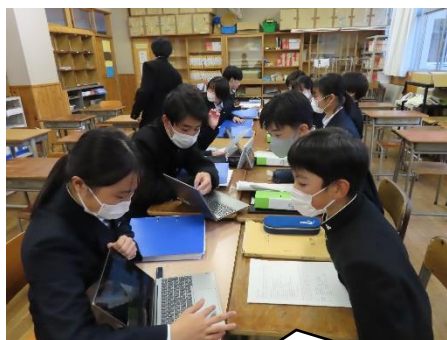
3年生の役員より、仕事内容の説明を受けます

「わからないことがあれば、いつでも聞いてね」と、仕事は引き継いでも、頼りになる先輩です