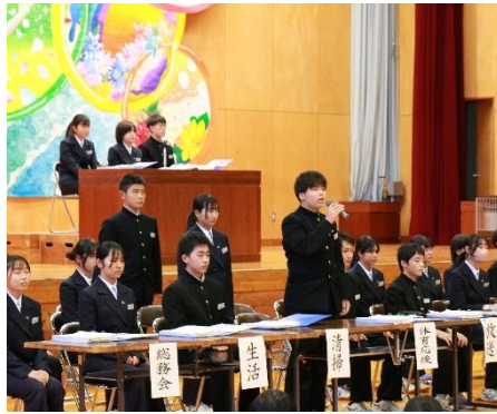
滞りなく審議・承認が行われました