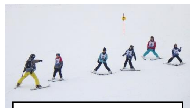
次は、左足体重のせて

今年は雪が少ないですが、スキー場にはしっかり雪があります。1月12日(金)に4年生がスキー教室に行ってきました。爺が岳スキー場は少し曇っていましたがそれほど寒くは無く、広々としたゲレンデを何度も滑り降りて楽しい時間を過ごしたようです。1月16日(火)には、3年生が行ってきました。怪我無くみんな元気で冬のスポーツのスキーを体験しました。