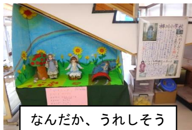
なんだか、うれしそう

本校には、青い目の人形が「アン」「メリー」「ジュエリー」の3人います。校舎改築が終わり、どこに展示しておくかといろいろ思案していたところ、あずさ学級の子どもの力を借りて階段下に展示することにしました。教室前等での展示作品に傷をつけない本校の子どもたちのすばらしさに期待し、ケースから3人を出して展示しています。「青い目の人形は、夜になると動き出す」とか「人がいなくなると話をしている」とか学校の七不思議