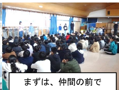
まずは、仲間の前で