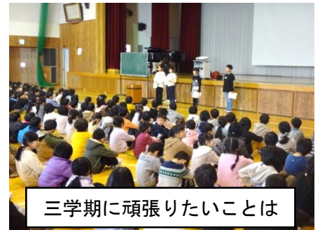
三学期に頑張りたいことは

学校長は、いつもの「3つのあ」についてお願いしました。特にこの三学期は、目標を立てて終わることなく、「一つでもやってみよう」と一つでもよいから目標に向けて自分にできることをやってみたり行動してみたりしてほしいとお願いしました。待つのでなく、実際に行動していくことで自分を変えていってほしいと感じています。人任せになったり「できなかった」と三学期の終わりに振り返ることなく、小さいことでもできることから少しずつ取り組んで目標を達成してほしいと思います。また、学校長が初詣に出かけた信濃国分寺八日堂縁日で手に入れた「蘇民将来符」も紹介し、今年一年間、梓川小学校の子どもたちが、けがや病気がなく元気に生活でき、身も心も大きく成長するようお願いを込めました。私も全校のみんなが「3つのあ」をよりよく進められるように、小さなことからコツコツと行動したいと思います。