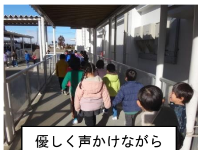
優しく声かけながら

数年ぶりに来入児一日入学を行いました。来入児と1年生が交流している間に、保護者説明会を行いました。1年生は交流を楽しみにしていたらしく、朝から「今日保育園が来るんだよ」「一緒に遊ぶんだ」と会う子の口から次々に聞かれました。自分たちが先輩として頑張らないとという意気を感じている様子がわかります。来入児のみんなは少し緊張気味でしたが、1年生と一緒に校舎内を探検しました。