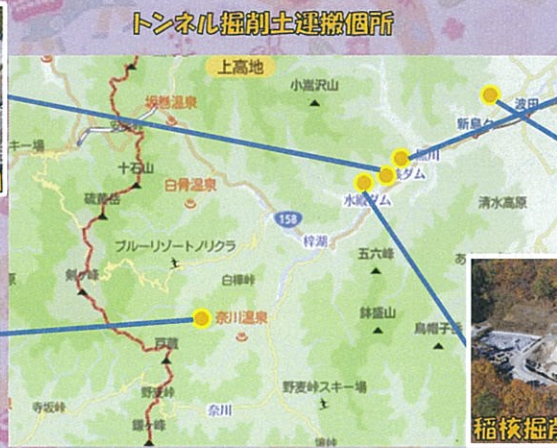
トンネル掘削土運搬箇所