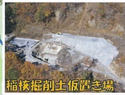
稲核掘削土仮置き場