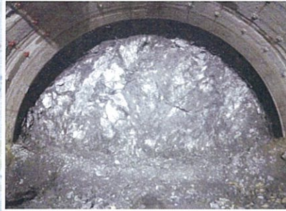
トンネル掘削先端切羽

残り工期は約1年半となりますが、本年も安全第一で工事を行いますので、引き続き皆様のご理解、ご協力の程よろしくお願い致します。