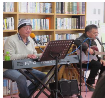
12月のふれ健の様子 (ミニコンサート)