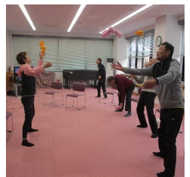
男しよの体力講座の様子