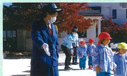
市内の幼稚園において女性部と市の交通安全教育担当で交通安全教室を実施した。