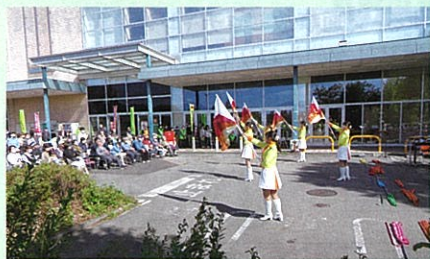
管内の商業店舗で県警音楽隊の演奏等を含めた交通安全イベントを実施した。

交通安全協会は、交通事故をなくすため、様々な活動を行っています。活動の一例を紹介します。