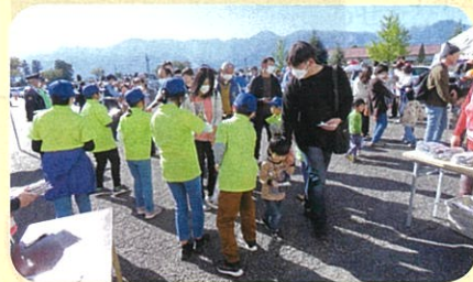
警察署主催のふれあいコンサート会場において少年部員による啓発活動を実施した。