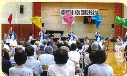
管内の小学校体育館において「高齢者交通安全大会」を開催した。