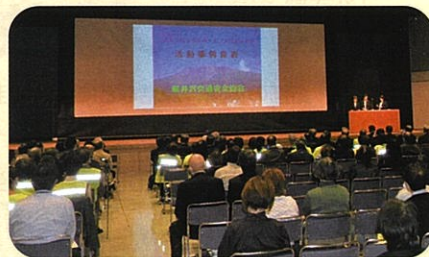
「交通安全協会長野県大会」において活動事例を発表した。