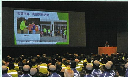
「交通安全協会長野県大会」において活動事例を発表した。