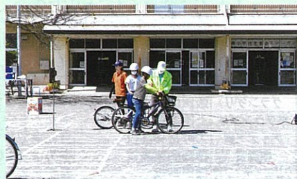
市内の小学校の交通安全教室において、児童に自転車の正しい乗り方について指導した。