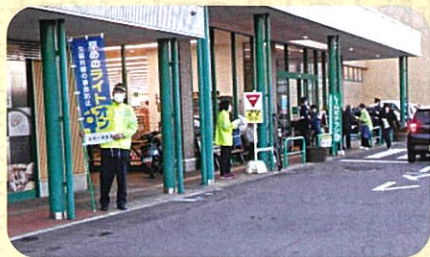
管内の商業店舗前で交通事故防止を目的とした啓発活動(サンセット作戦)を実施した。