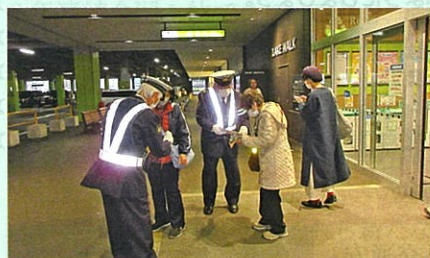
夜間における交通事故防止啓発活動として、管内の大型商業施設においてサンセット作戦を実施した。