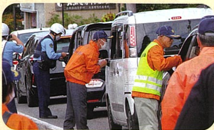
管内の主要交差点において交通事故防止啓発活動を実施した。