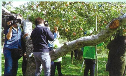
交通安全活動の一環として関係機関に配布する「交通安全リンゴ」のシール貼りを行った。