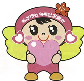
松本市社会福祉協議会 マスコットキャラクター つむぎちゃん