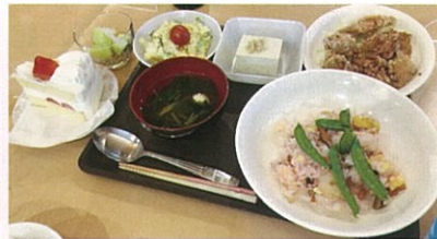
バランスの良い食事を手作りしています。