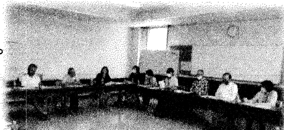
島立地区視察の様子