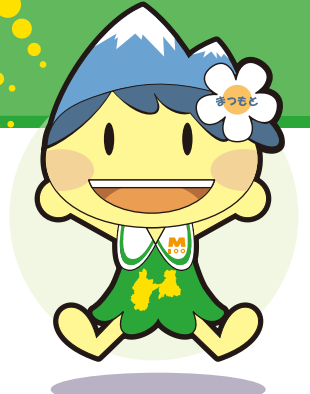
▲松本市マスコットキャラクター「アルプちゃん」