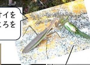
ウマオイの羽も観察