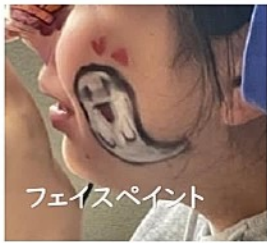
フェイスペイント