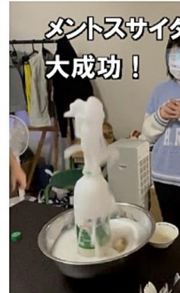
メントスサイダー&コーラ 大成功!