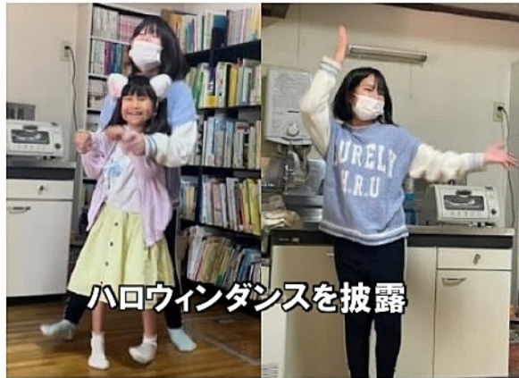
ハロウィンダンスを披露