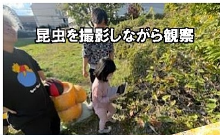
昆虫を撮影しながら観察