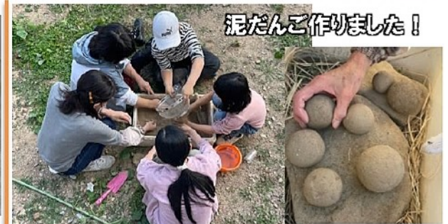
泥だんご作りました!