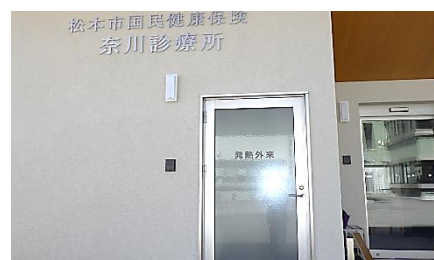
入口横の発熱外来