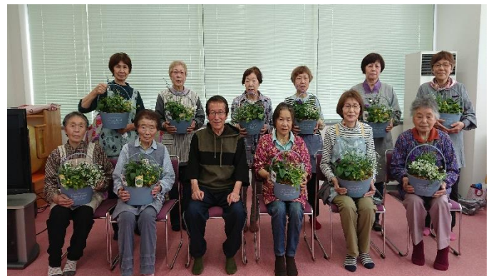
5月の寄せ植え教室

※ 保健師・包括支援センター職員が秘密厳守で対応します。どんなことでもご相談ください。