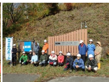
モニュメントの前で記念撮影