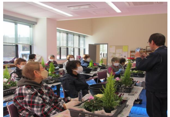
11月のささゆりひろばの様子 (アルプス草笛の会)