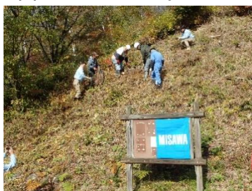
御殿桜の記念植樹

自然豊かな奈川の魅力に参加者一人ひとりが再発見し、奈川の‘みかた’が増えた実感できる一日となりました。