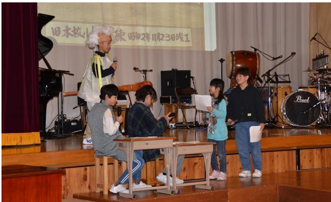
記念式典の様子。小学生が「奈川学校の歴史」を劇形式で発表しました。

「奈川学校150周年 記念式典・記念音楽会」が、10月14日(土)、15日(日)に、奈川小中学校にて行われました。