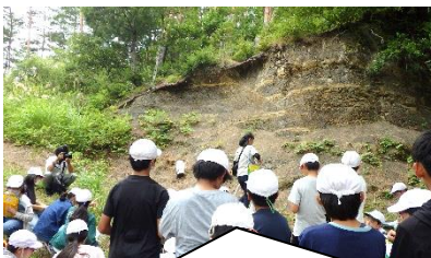
四賀地区へ地層見学に行きました。断層見学や化石採集、化石館などで大地の成り立ちを勉強しました。