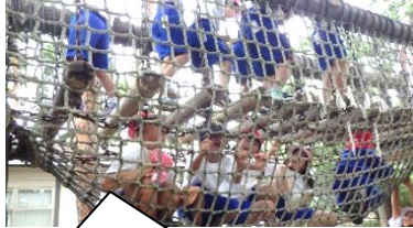
梓水苑へ、長い距離を歩いて行ってきました。