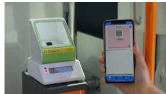
▲キャッシュレス機器（写真は実証時）