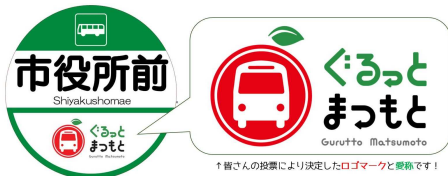
▲「公設民営バス」公式ロゴマーク

地域内全路線に二次元コード・クレジットカードタッチ決済を導入するほか、GTFS-JPの整備や、県の交通・観光案内アプリ「信州ナビ」を通じたバスの走行位置の発信などを推進する。