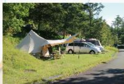
野麦峠オートキャンプ場