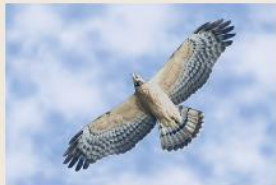
タカの渡り 見頃:9月中旬～10月上旬