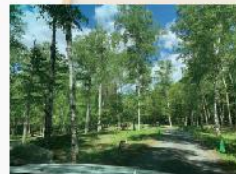
高ソメキャンプ場