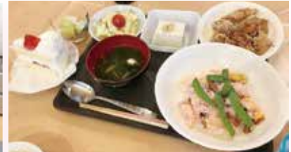
バランスの良い食事を手作りしています。