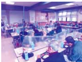
ふれあい会食会（中央地区）