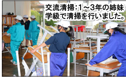
交流清掃：1～3年の姉妹学級で清掃を行いました。