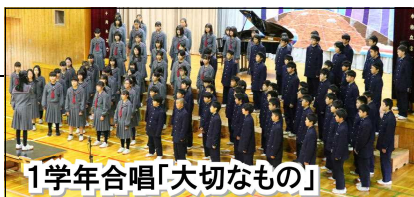
1学年合唱「大切なもの」