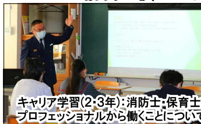
キャリア学習(2・3年)：消防士・保育士など地元の6名のプロフェッショナルから働くことについて学びました。