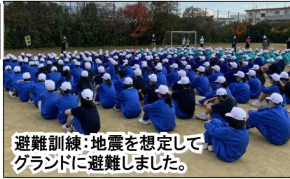
避難訓練：地震を想定してグラウンドに避難しました。