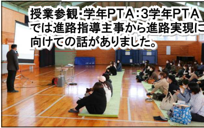
授業参観：学年PTA・3学年PTAでは進路指導主事から進路実現に向けての話がありました。