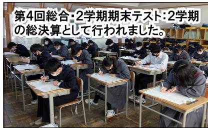
第4回総合・2学期期末テスト：2学期の総決算として行われました。