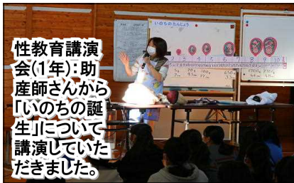
性教育講演会(1年)：助産師さんから「いのちの誕生」について講演していただきました。

◆11/19(金)「PTA常任委員・町内代表選出会」へのご出席、ありがとうございました。今後とも、PTA活動へのご協力ご支援、よろしくお願いいたします。