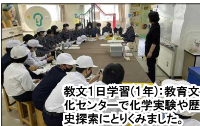
教文1日学習(1年)：教育文化センターで化学実験や歴史探索にとりくみました。