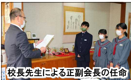
校長先生による正副会長の任命