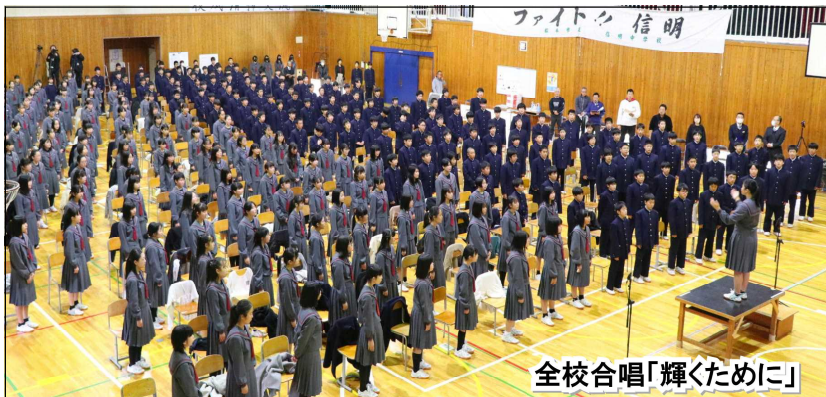
全校合唱「輝くために」

合唱発表会 ：新型コロナウイルス感染拡大の影響を受け、飛翔祭(10月)から11月に延期された合唱発表会が19日(金)、信明中学校体育館で催されました。本格的に練習の再開が認められた10月以降、限られた時間の中で最大限の努力を重ね、クラスメイトや学年の仲間と作りあげてきた合唱は、優しく、力強く、染みいるように聴く者の心を包みこみ、体育館いっぱいに響き渡りました。特に、3年生が奏でてくれた圧巻の合唱は、「信明中学校の伝統」として、1・2年生の心に深く刻みこまれたことと思います。