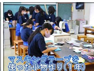
マスキングテープを使った小物作り(1年)