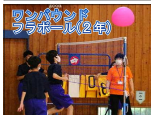
ワンバウンドフラボー(2年)