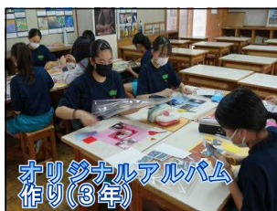
オリジナルアルバム作り(3年)