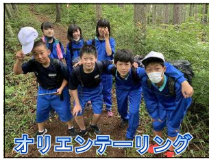
オリエンテーリング

7月15日(木)、1学年が 高遠フィールドワーク を実施しました。「CR ~Call & Response(呼びかけに応えよう!)/Create the Rainbowcolor Memories(虹色の思い出をつくらう!)-」をテーマに、入学してから4ヶ月、1学期の集大成ともいえる行事に臨みました。班の仲間と協力してオリエンテーリングや飯盒炊爨にとりくむ姿、つくりあげたカレーライスを笑顔でほおぼる姿に、1学期の確かな成長を感じることができました。