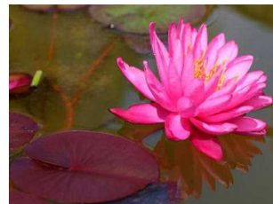
中庭“洗心の泉”に咲く睡蓮。 睡蓮の花言葉は“信頼”です。

本日より 2学期 です。2学期の登校日数は 83日 。今は夏でも、2学期が終わるころには冬を迎えています。3つの季節にまたがる2学期が、生徒の皆さんにどんな “実り” をもたらしてくれるのか、今からわくわくしています。