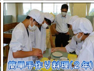
簡単手作り料理(2年)

7月7日(水)・8日(木)、旅行的行事の先陣をきって、 3学年旅行 が実施されました。新型コロナウイルス感染拡大の影響を受け、行き先を白馬・大町方面へ変更しての実施となりましたが、「空前絶後の学年旅行 ～北アルプスを 学んで 食べて 楽しもう～」をテーマに、2月から事前学習や係活動にとりくんできました。初日は、黒部第四ダムの迫力に圧倒されたあと、鹿島槍スポーツヴィレッジで竹巻きパンやアイスクリームづくりに挑戦しました。クラスごと分宿した夜は、花火を楽しみ、クラスメイトと心ゆくまで語り合いました。2日目は、白馬EXアドベンチャーで森林空中散歩に挑戦し、昼は大自然の中、バーベキューを満喫しました。まさに、テーマを追求しつくした素敵な2日間になりました。