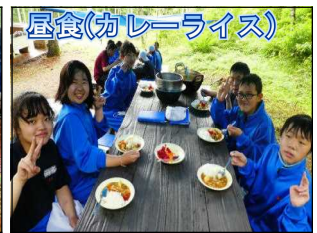
昼食(カレーライス)

7月27日(火)・28日(水)、旅行的行事のしめくくりとして、2学年が キャリアアップin八ヶ岳 に出発しました。キャリア学習の一環として、「働く」ことについて学習を積み重ねてきた2学年にとって、体験によって学びを深める絶好の機会となりました。テーマは「ONE FOR ALL」です。八ヶ岳農業実践大学校を舞台に、初日の午前中は林業、午後は講座に分かれて木工や炭焼きなど、働くことについて体験しました。2日目も初日とは講座を変えて、酪農や養鶏について体験した2年生は、確実にひとまわり成長したように感じました。