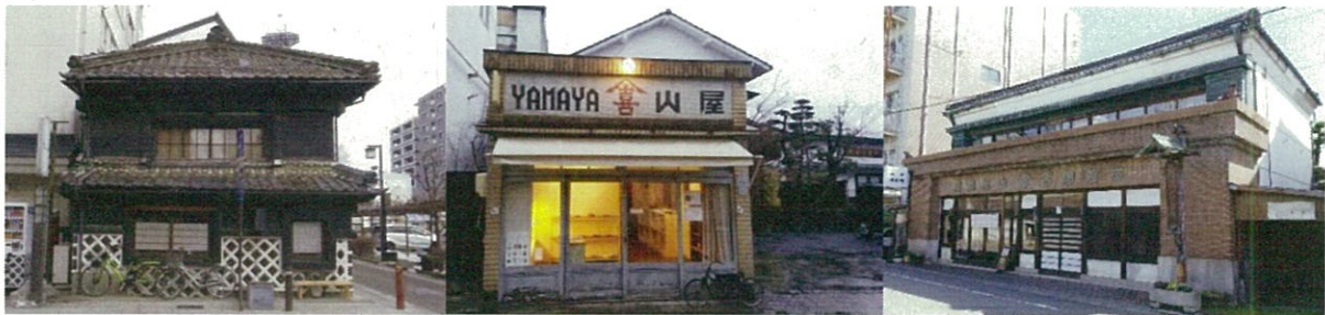
松本市近代遺産の例

松本市では、松本城を中心としたまちづくりを進めるため、近代（明治以降）のまちの歴史を伝え、まちの魅力向上につながる建造物の保全活用を図る取り組みとして、「松本市近代遺産」の登録を行っています