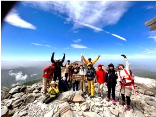
7月6日 5年生登山キャンプ 剣ヶ峰

5月に新型コロナウイルス感染症が5類に移行したことで、昨年までのような行動制限が解除され、学校生活も以前のような状況に少しずつ戻った1学期でした。そのため、多くの行事にも取り組むことができ、通常の授業だけでは見ることができない、人と人とのつながりから生まれる笑顔を、たくさん見ることができました。