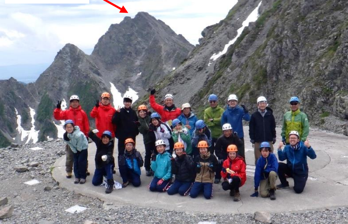
7月19日 穂高岳山荘近くのヘリポート