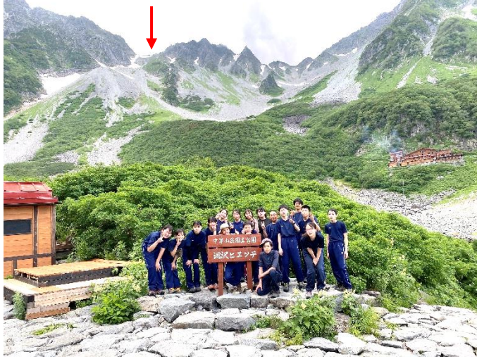
7月18日 涸沢ヒュッテ到着記念集合写真