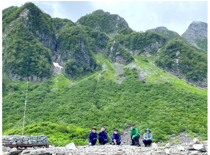
7月19日 パノラマコース 昼寝岩