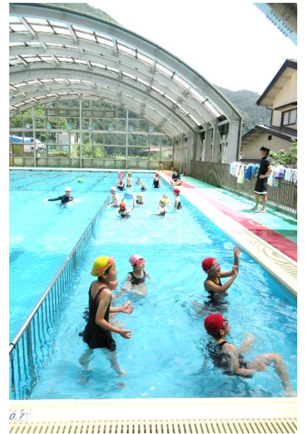
7月7日 3・4年生 3校交流会

2学期は、8月18日(金)にスタートします。夏休み中に、2学期に向けてのエネルギーをたっぷりチャージしてください。