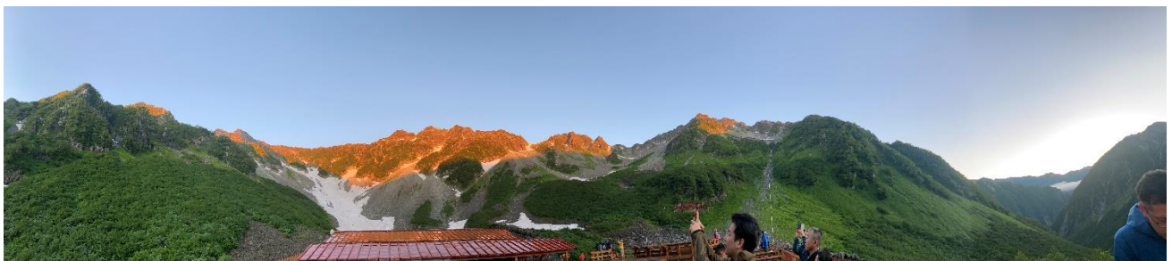
7月20日 モルゲンロート