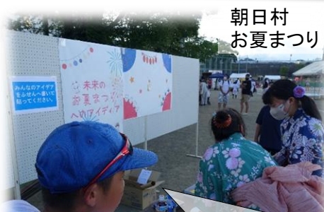
朝日村 お夏まつり

「未来のお夏まつりがこうだったらいいな」というアイデアを来場した方に書いてもらいました。