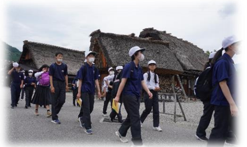
上高地・白川郷 散策