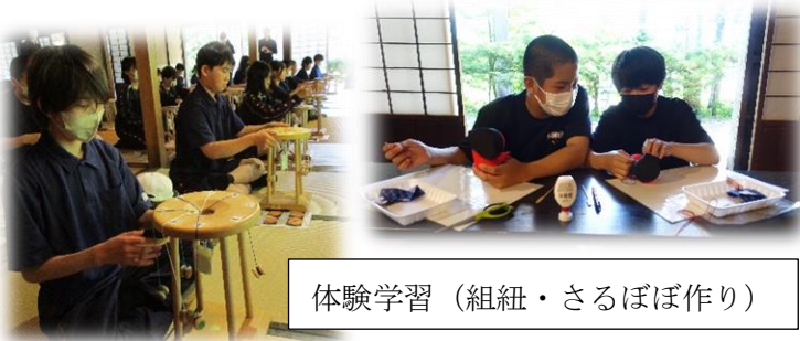
体験学習（組紐・さるぼぼ作り）