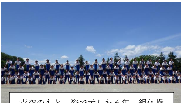
青空のもと、姿で示した6年 組体操

しかし、どの学年の子ども達も、自分なりのめあてをもって、一生懸命に競技や演技に取り組む姿や、他学年と友だちに声援を贈る姿が見られました。このような子ども達の姿一つ一つが晴れ渡った空と校庭に映え、感動する名場面の数々につながったのだと思います。