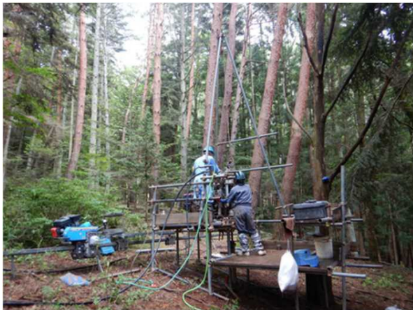
地質ボーリング調査例