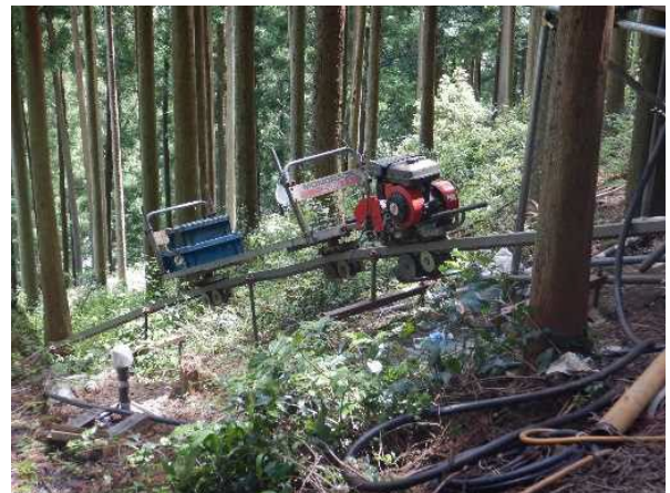
機材搬入用モノレール設置例

※なお、地質ボーリング調査に際しては、必要な個所において下草刈りを実施させていただきますが、樹木の伐採は致しません。