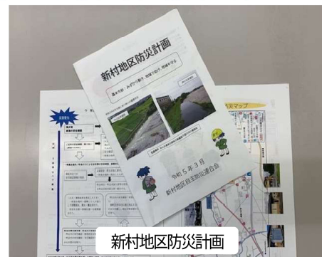
新村地区防災計画

これを受けて、「新村地区防災計画」をこの6月号に併せ全戸配布し、平常時の活動計画や、災害時に必要な活動の詳細等の周知を図ることとしました。