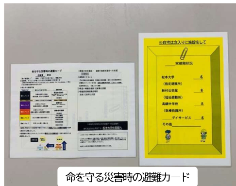
命を守る災害時の避難カード

また、これとともに「命を守る災害時の避難カード」を作成しました。このカードは北新西町会のもの进行参考にしており、表面に水害の警戒レベル早見表や、災害発生時における町会の一時集合場所や組単位の安否確認場所のほか指定避難所がすぐにわかるようにまとめられています。また、裏面には、災害発生後家族がどこに避難したかをマジック等で記入し玄関等へ表示することで避難先や避難が完了しているかを確認できるようになっています。「新村地区防災計画」と一緒に全戸配布しますので、平常時はこのカードを冷蔵庫等見やすいところに貼っておき、災害時には裏面を記入し玄関等に掲示していただくようお願いします。