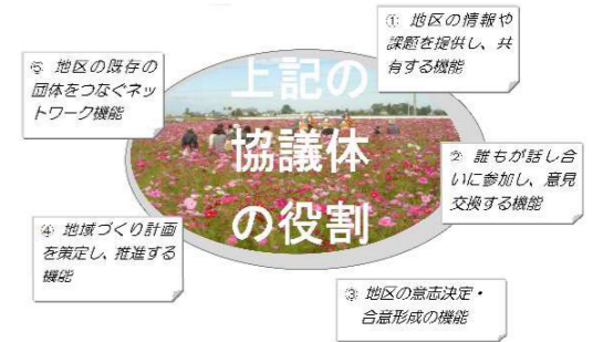
新村の地域づくりシステムイメージ図

議事については、令和4年度の事業報告、会計報告、令和5年度事業計画、予算案が承認されました。また、今年度から新たに会計と監事を各1名選任することに伴い、会の規約の改正についても審議され承認されました。今年度も「地域振興」「安全安心」「いきいき」「学びの友」の4部会を中心に、町会連合会と足並みを揃え、新村地区が安全安心にいきいきと暮らし続けられる地域となるよう取り組んでまいります。