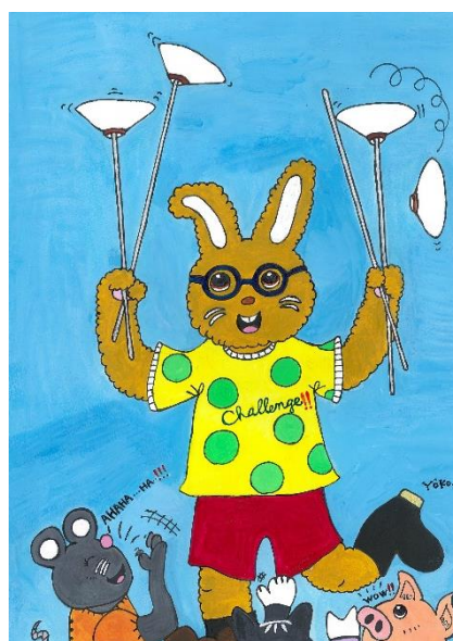
布施 陽子作「うさぎの曲芸」

○窓口 障がい福祉課 電話 34-3212 FAX36-9119 こども福祉課 電話 33-4767 FAX36-9119 西部福祉課 電話 92-3002 FAX92-7112