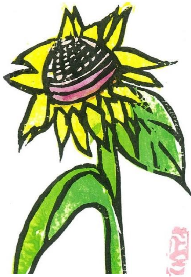
野口 聡子作「夏の光」