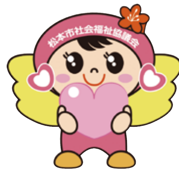
松本市社会福祉協議会 マスコットキャラクター つむぎちゃん