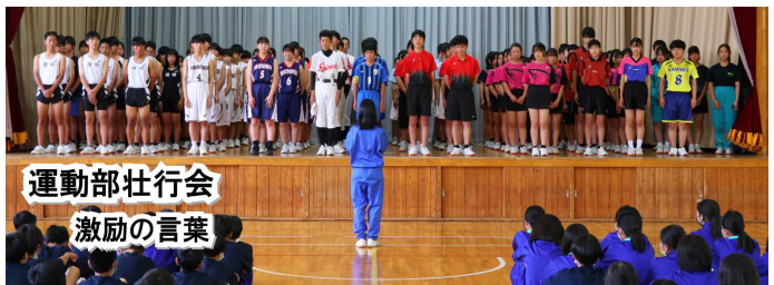
運動部壮行会 激励の言葉

援の力で仲間を支えたい」「3年間積み上げてきた練習の成果を出し切れるよう、最後まで仲間を信じて戦いたい」「3年間の取り組みを支えてくれた顧問の先生、お家の方への感謝を忘れず、自分たちのすべてを出し切りたい」など、力強い発表がありました。また、文化部部长や校長先生からは激励として「懸命に練習に取り組む皆さんの姿を見てきました。皆さんなら大丈夫。自分や仲間を信じて、全力で戦ってきてください」「最後まで諦めずに戦うことが、勝敗以上に皆さんにとっての大切な宝物になると思います。悔いのない試合をしてください」といった言葉がありました。最後に、体育応援委員長のコールにあわせ、体育館中に響き渡る“フレイフレイ信明、や今ぞ燃ゆ、で、選手の健闘を後押ししました。6月3日(土)・4日(日)、全校の皆さんからの応援を背に、先陣をきって 中信大会 に臨んだのは陸上部と卓球部の皆さんでした。全力で走ったり、打ちぬいたりする姿は、激励の言葉にあった「悔いのない試合」を見事にフィールド、トラック、そしてアリーナで実現していました。10日(土)・11日(日)には、加えて男女バスケットボール部、男女ソフトテニス部、サッカー部の皆さんが、17日(土)・18日(日)は、さらに野球部、バレー(委任)の皆さんが、すべてを出し尽くして戦ってきました。そして今週末の24日(土)・25日(日)は、水泳(社体)、バドミントン(社体)の皆さん、7月には体操(社体)の皆さんも、大会に臨みま