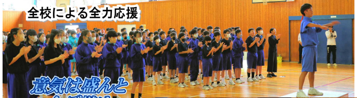
全校による全力応援