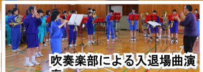
吹奏楽部による入退場曲演

6月に入り、信明中学校は 人権学習強調月間 を迎えました。人権学習の始まりにあたり、校長先生にお話をさせていただきました。