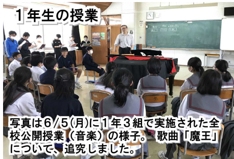
1年生の授業 写真は6/5(月)に1年3組で実施された全校公開授業(音楽)の様子。『魔王』について、追究しました。

5月23日(火)、1年生の 小中連絡会 がありました。入学して2ヶ月、中学生として元気に活動している姿を、小学6年時の担任の先生方に参観していただきました。参観後の連絡会では、小学校の先生方から「元気に授業に取り組んでいるようで安心した」「中学校の3年間はあっという間。学習や部活など、悔いのない学校生活を送ってほしい」といった声が寄せられました。1年生にとっての学びの過程は、始まったばかりです。これからのさらなる成長に期待が膨らみます。