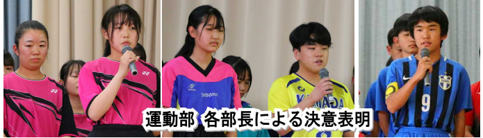
運動部 各部長による決意表明