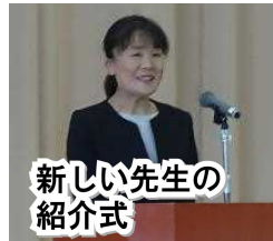
新しい先生の紹介式

6月1日(木)、 運動部壮行会 が開かれました。今年は、応援歌「いまぞ燃ゆ、」が復活し、4年ぶりに完全な形で実施することができました。吹奏楽部が演奏する「ウィーアー！」の曲にのり、ユニフォーム姿で堂々と入場した選手の皆さんと、それを全力で応援しようとする全校の皆さんが対面し、一体感あふれる素敵な空間をつくりだすことができました。部長一人一人からは「全員が自己ベストを出せるよう、一人一人が全力を尽くすだけでなく、応