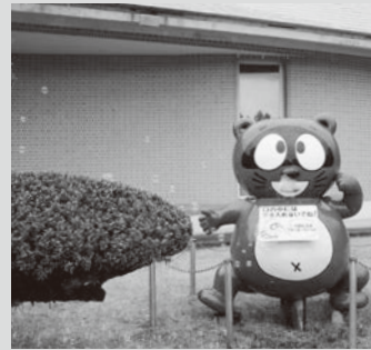
▲「シャボン玉」の音楽に合わせ、シャボン玉が出てくる仕掛けのモニュメント。