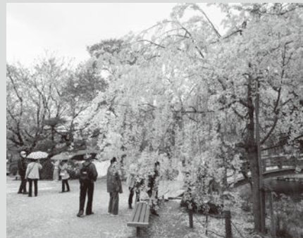
▲しだれ桜などの桜を楽しみました。