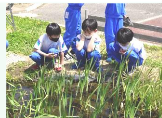
見守る子どもたち