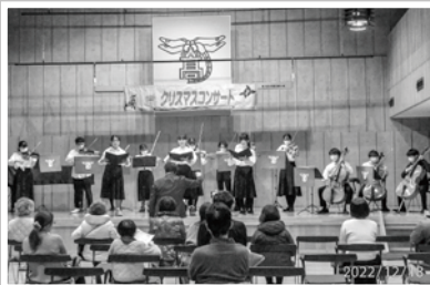
▼蟻ヶ崎東町会だべり会