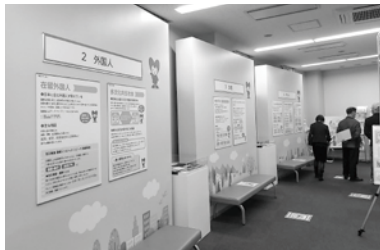
▲センター内では、パネル展示をとおして様々な人権問題を学べます。

終わりに、「社会は様々な人々の集合体。私たちもその一員であり、だれでもが互いに隣人です。そこにいるのは『人』なのです」の言葉で講習を締めくくりました。今回の研修は、外国人の方と共生していくことを考えるよい機会となりました。