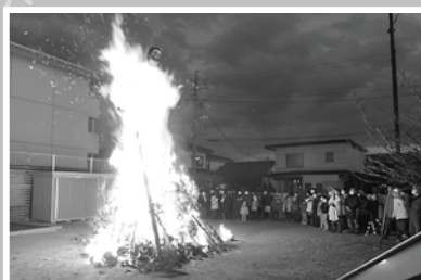
▲田町・新田町・北馬場・徒士町・旗町町会