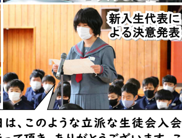
新入生代表による決意発表の言葉