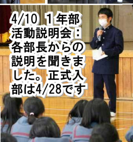
4/10 1年部活動説明会：各部長からの説明を聞きました。正式入部は4/28です

本日は、このような立派な生徒会入会式を行って頂き、ありがとうございます。これから始まる中学校生活に期待と不安がありますが、新しい友だちや、先生方とともに、学習や部活動、学校生活を、一生懸命頑張り、悔いのない中学校生活を送りたいと思います。