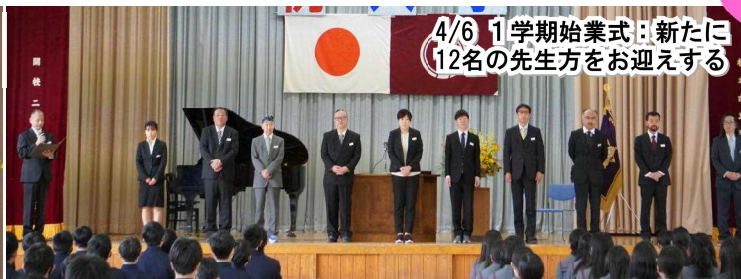
4/6 1学期始業式：新たに12名の先生方をお迎えする