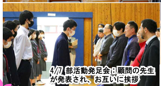
4/7 部活動発足会：顧問の先生が発表され、お互いに挨拶