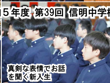
真剣な表情でお話を聞く新入生