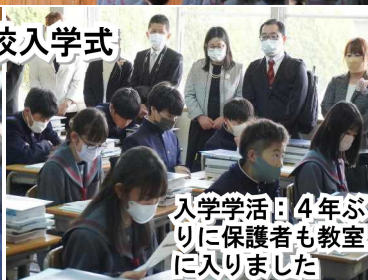
入学学活：4年ぶりに保護者も教室に入りました