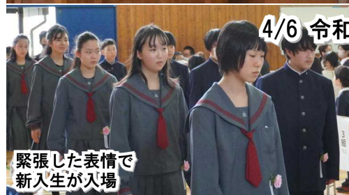
緊張した表情で新入生が入場