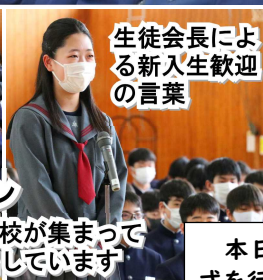
生徒会長による新入生歓迎の言葉

先輩が拍手する中、新入生が入場。4年ぶりに全校が集まって生徒会入会式を実施。本来の活動が確実に動き出しています