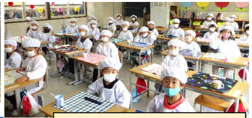
給食の準備は、ばっちり！

1年生も給食が始まり、みんなと同じ時間で下校する日常を送るようになりました。どれも初めてのことで、毎日がドキドキ・ワクワク。先生と一つ一つ丁寧に覚えていきます。楽しい遊び場や素敵な場所を見つけた子も多いようで、遊びに誘ってくれる6年生とも仲良く関わる姿も増えています。