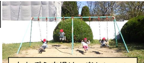
あおぞら広場は、楽しい！！

1年生も給食が始まり、みんなと同じ時間で下校する日常を送るようになりました。どれも初めてのことで、毎日がドキドキ・ワクワク。先生と一つ一つ丁寧に覚えていきます。楽しい遊び場や素敵な場所を見つけた子も多いようで、遊びに誘ってくれる6年生とも仲良く関わる姿も増えています。