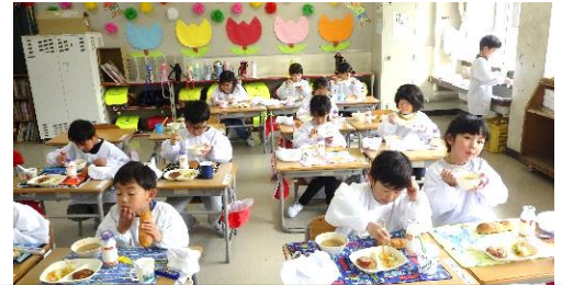
初めての給食、とってもおいしいよ！