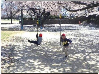
楽しみにしていた ターザンロープ