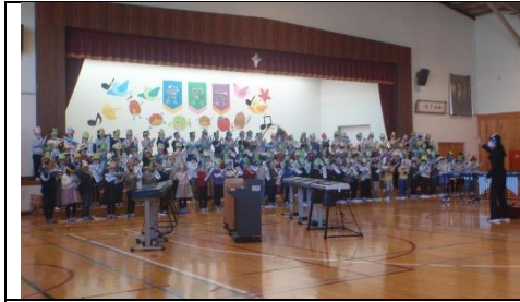
1年生、初めての音楽会。鍵盤ハーモニカと合唱で「ジャップ」しました。