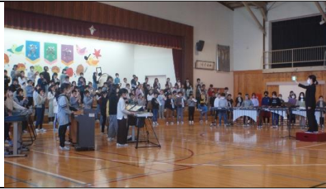
6年『ライオンキング』、壮大な合奏曲の演奏に観客の皆が吸い込まれました。

昨年度は実施できなかった音楽会。感染対策を取りながら今年度は2日間に分けて、行いました。