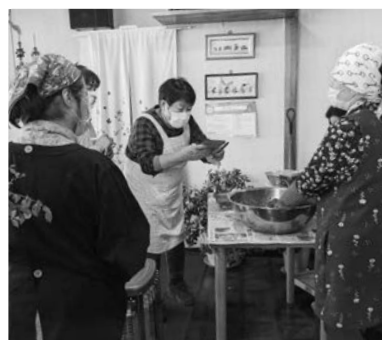
プロの味を伝授していただく参加者