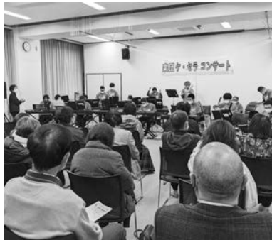
3年ぶりの生演奏に皆さん感激!