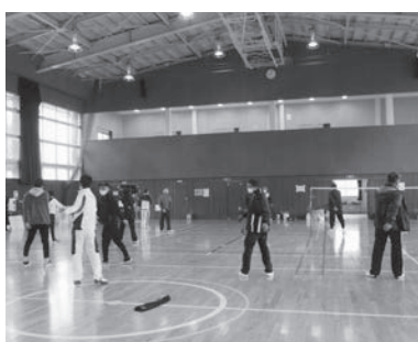
ケガのないよう、ラジオ体操からスタート

また、松本市健康づくり課から理学療法士、健康運動指導士、保健師も参加して体力測定や保健指導も行われ、半日ではありましたが参加者一同、久々に体によさしい時間を持つことができました。