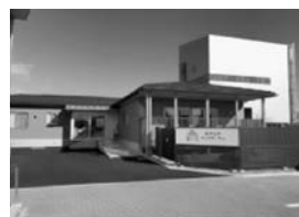
【はやしやキッズガーデン】

生を目的として、保育事業を始めました。本社棟の横に2019年12月に保育園「はやしやキッズガーデン」を開園いたしました。