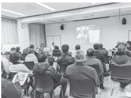
いざという時、避難所の早期開設について説明を聞く参加者

2月17日(金)午後7時から、和田公民館において和田地区防災・避難所運営研修会が開催されました。