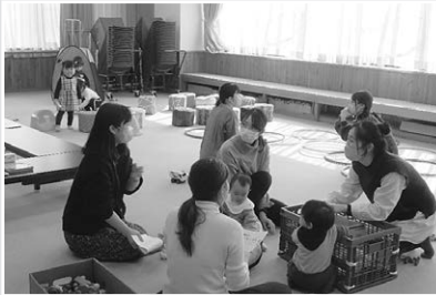
なかよくお話し中