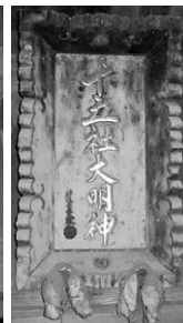
旧十五社 大明神社額