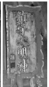
旧鎮守 大名神社額