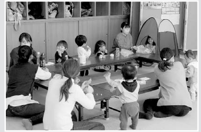
みんなでおやつタイム