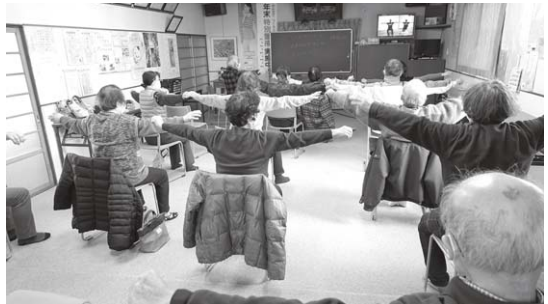
3年ぶりに出張ふれ健を開催 ～ 100歳体操で体を動かす参加者～