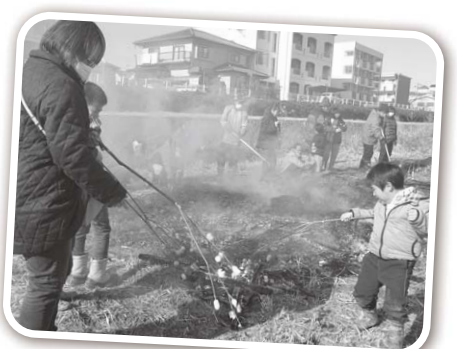
見栄えする親子の三九郎