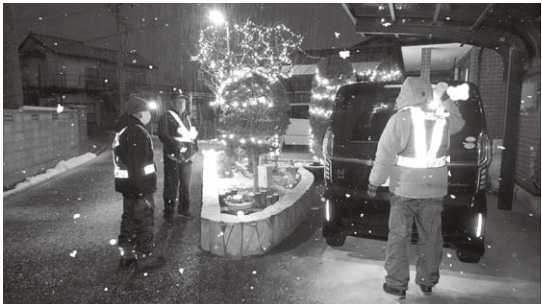
年末警戒の夜警巡回を今年も実施