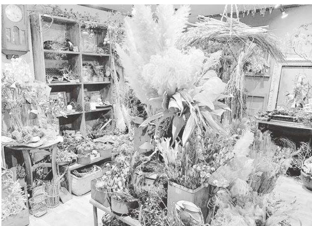
店内の様子 (カラーでないのが残念)

このお店を開いたのは、ドライフラワーが好きという事もあります。ドライフラワーの専門では非常に珍しいのはじめてみました。