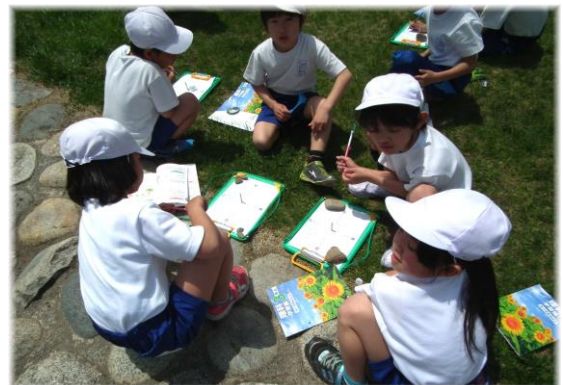
(上) 3年生が理科の時間に、影の長さを測定しています。朝と昼では影の長さや向きがちがっていることに気づきます。