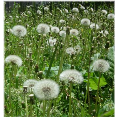
たんぽぽも、あっという間に綿毛になってしまいました。

学校としては大きなけがや事故がなく、7日月曜日に子ども達が元気に登校してくれたのが何よりです。また、休み明けの欠席も例年より少なめでしたが、まだインフルエンザがでているのが少し心配です。これから6月2日の「運動会」という大きな行事に向けて進んでいきます。5年生は臨海学習もあります。夏休みになるまで大きな連休はありませんが、その分 勉強や行事にじっくり取り組んでいきましょう。