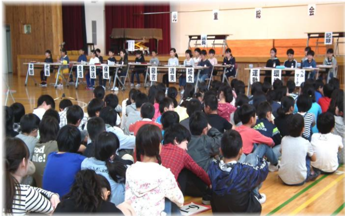
児童集会がありました。今年のスローガンも発表されました。「1UP ～協力しあおう 助けあおう～」です。