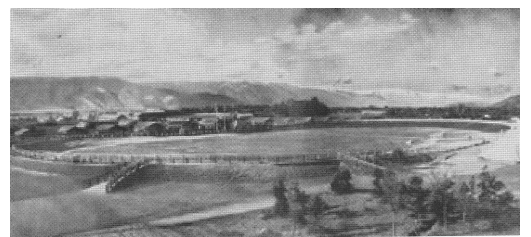
宮田東にあった松本競輪場

1949年、宮田製作所という工場だった土地の一部を使って、松本市競輪場 けいりんじょう が開設されました。しかし、経営がうまくいかず4年 せいざくしょ で廃止されました。その後はしばらく空き地のままでしたが、1970年に開明小学校が開校しました。