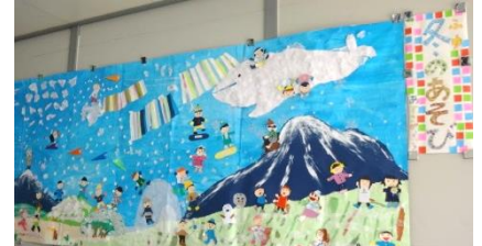
プレハブ校舎昇降口掲示(あずさ学級)

今日で3学期の学校生活が終わりました。1年生から5年生にとっては、それぞれの学年教育課程の修了となります。本日、通知表をお渡ししました。最後のページには、修了した証として校長印が押されています。お子さんの1年間のがんばりを振り返っていただくとありがたいです。なお、1日早く春休みとなりますが、修了証の期日は3月16日となっています。ご了承ください。