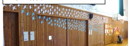
全校の仲間からのメッセージ

6年生の皆さんは、「感謝プロジェクト」として、花壇の柵や水捨て場の看板、トイレ入口の暖簾や遊具、スクールバスの正しい乗り方動画等を作ってくれました。学校奉仕活動として校舎内の清掃も進めてくれました。最高学年として、学校のこと、そして、後輩のことを大事に思って行動してくれる6年生に感謝です。明日は卒業証書授与式です。保護者の皆様にご参列いただき、137名(副学籍含む)に卒業証書を授与させていただきます。長いようで短かった小学生時代であったかと思えます。ぜひ、小学校のよき思い出と梓川小学校の卒業生という誇りを持って、新たな一歩を踏み出してください。